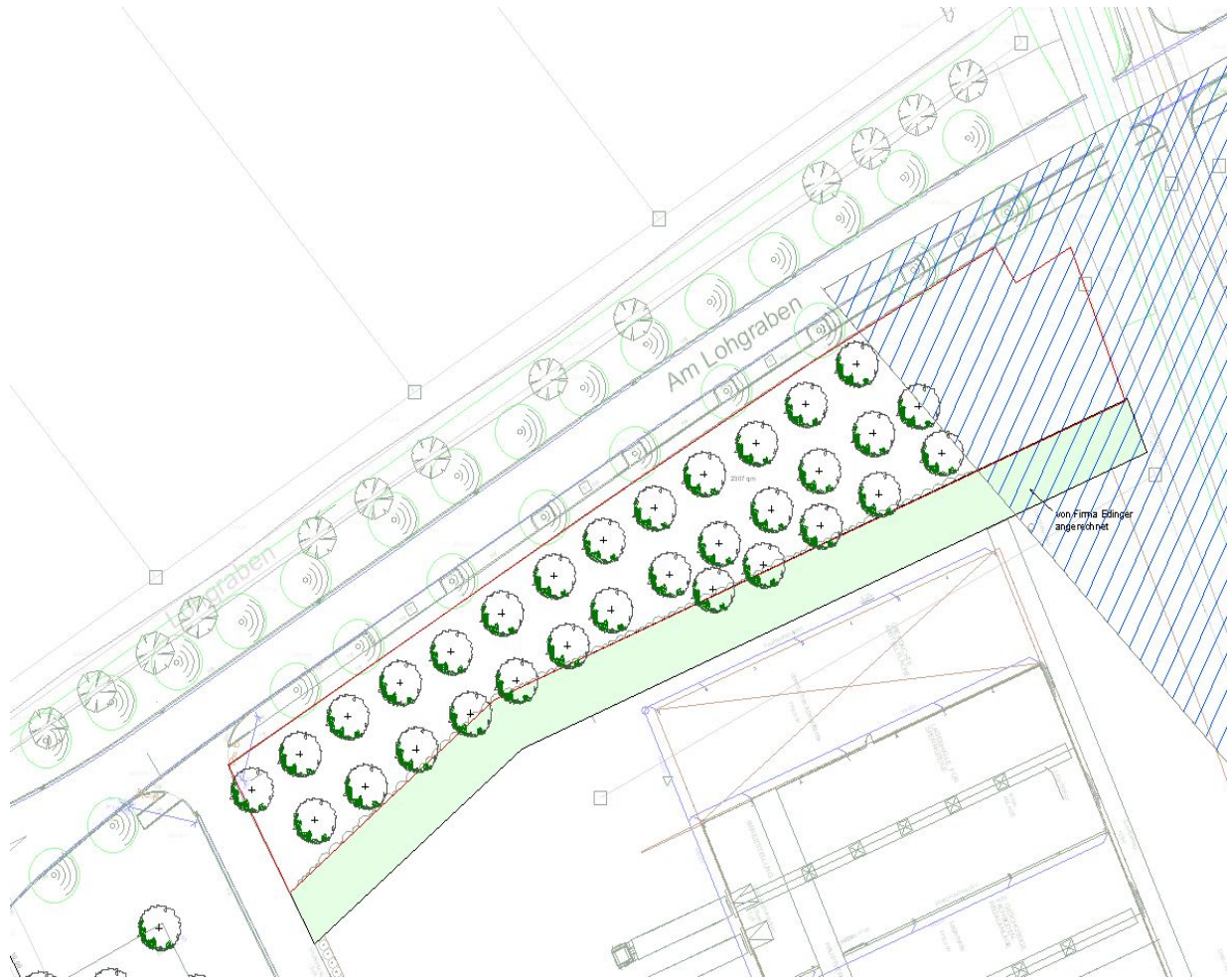
Abb. Lage der Ausgleichsfläche im Gewerbegebiet Lohgraben